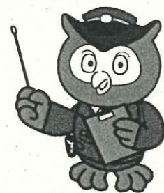
愛知県警察 マスコットキャラクター コノハけいぶ